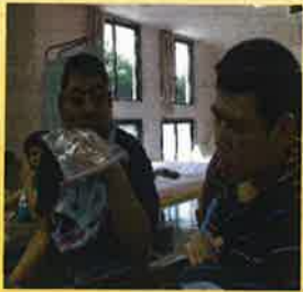
政樹も捕まえるか？